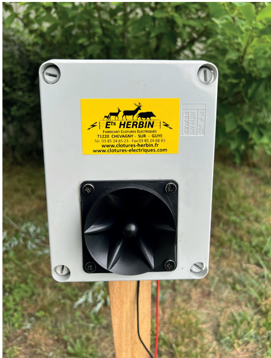
Réf. 135 - 12V

Le PRO 22 est un effaroucheur acoustique à ultrasons destiné uniquement aux professionnels.